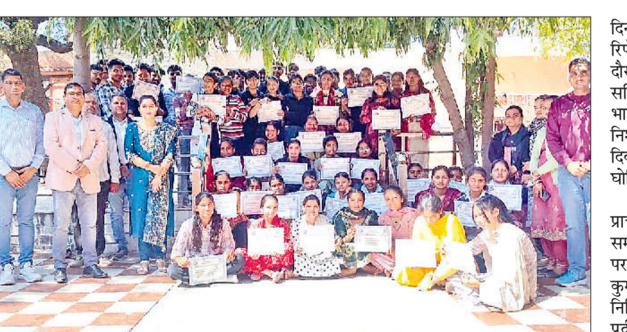
इज्जर। शिक्षकों के साथ उपस्थित स्वयंसेवक।