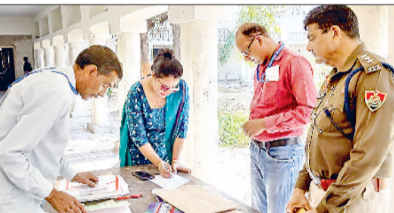
झंझर। परीक्षा केंद्रों का निरीक्षण करती एसडीएम व एसीपी।

हरियाणा विद्यालय शिक्षा बोर्ड द्वारा दसवीं और बाहरवीं कक्षा की परीक्षाएं आयोजित की जा रही हैं। वीरवार को दसवीं कक्षा की गणित विषय की परीक्षा आयोजित की गई। परीक्षाओं को लेकर जहां सुरक्षा के पुख्ता इंतजाम किए गए, वहीं विभिन्न उड़नदस्तों की टीमों भी परीक्षा केंद्रों का निरीक्षण करती रही। जिसके कारण परीक्षा