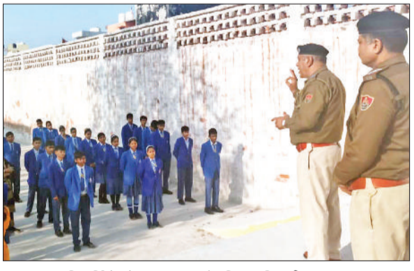
बहादुरगढ़। विद्यार्थियों को जागरूक करते पुलिस अधिकारी।