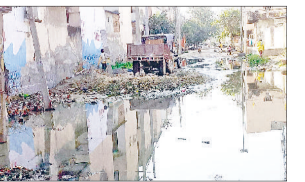
बहादुरगढ़। शास्त्री नगर व सेक्टर-9 के बीच गुजरने वाले रास्ते पर फैली गंदगी।

सौंदर्यकरण और विकास के दावों के बीच बहादुरगढ़ में कुछ जगह ऐसी भी हैं, जहां लोगों को पैदल चलने तक का भी रास्ता नहीं मिल रहा। रोजाना सैकड़ों लोगों को भारी परेशानी का सामना करना पड़ रहा है। नीलवाला गाँडा पर भी कुछ ऐसे ही हालात बने हैं। यहां शास्त्री नगर और सेक्टर 9 के बीच