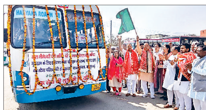
बेरी। बस को हरी झंडी दिखाकर रवाना करते हुए भाजपा प्रदेशाध्यक्ष मोहन लाल बडौली।

प्रदेशाध्यक्ष मोहनलाल बडौली ने बस को हरी झंडी दिखाकर रवाना किया। इस दौरान उन्होंने कहा कि हरियाणा देवी-देवताओं को पावन भूमि है। बेरी की धरा पर स्थित माता भीमेश्वरी देवी मंदिर देश के विभिन्न राज्यों से श्रद्धालु दर्शन के लिए पहुंचते हैं। उन्होंने कहा कि यहां दर्शन करने के बाद अनेक श्रद्धालु गुरुग्राम स्थित शीतला माता मंदिर में भी माथा टेकने जाते हैं। श्रद्धालुओं की सुविधा और उनकी आस्था को ध्यान में रखते हुए यह सीधी बस सेवा शुरू की गई है, जिससे यात्रा सुगम, सुरक्षित और