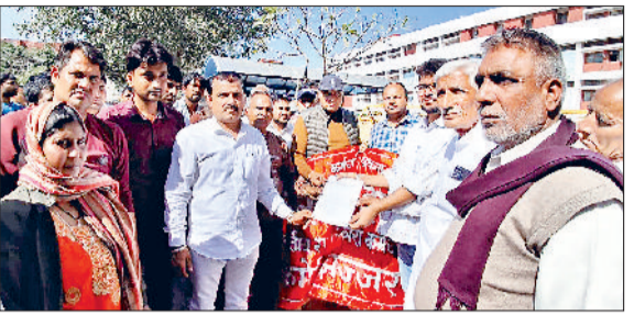
इज्जर। प्रदर्शन के बाद तहसीलदार को ज्ञापन सौंपते हुए कर्मचारी।