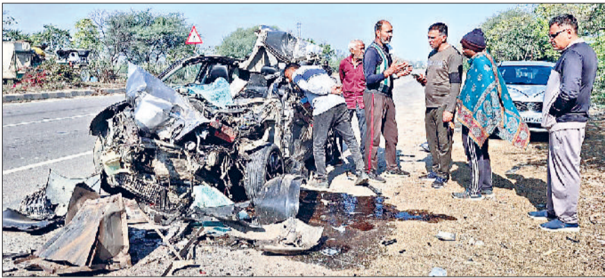
झंझर। दुर्घटना के बाद क्षतिग्रस्त हुई कार व मौके पर खड़े लोग।